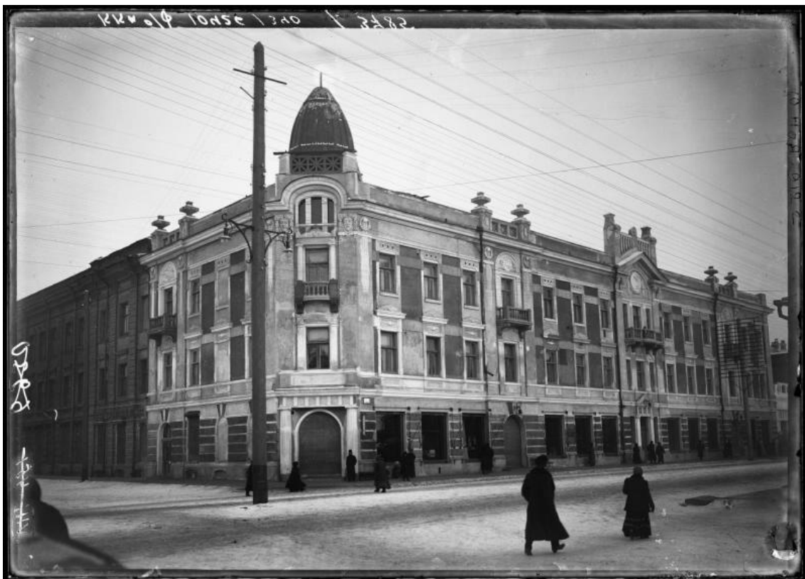
Рис. 3. Торговый дом купца 1-й гильдии П.И. Гадалова на Воскресенской улице. 10 ноября 1912 г. [6, № 10426/340].

Первоначальная декоративная отделка здания соответствовала стилистике классицистической эклектики (рис. 2), отличалась сдержанностью и строгостью элементов убранства. В уровне первого этажа плоскость фасадов имела отделку в виде декоративного руста. Рустованные пилястры разделяли фасады здания по всей высоте. Между первым и вторым этажами по периметру всего здания был выполнен профилированный карниз. Окна первого этажа арочные, второго и третьего прямоугольной формы, декорированные наличниками. Плоскость фасадов здания завершалась узким профилированным поясом и карнизом. Венчался объем глухим парапетом. Срезанная угловая часть акцентировалась завершением в виде фигурного аттика.