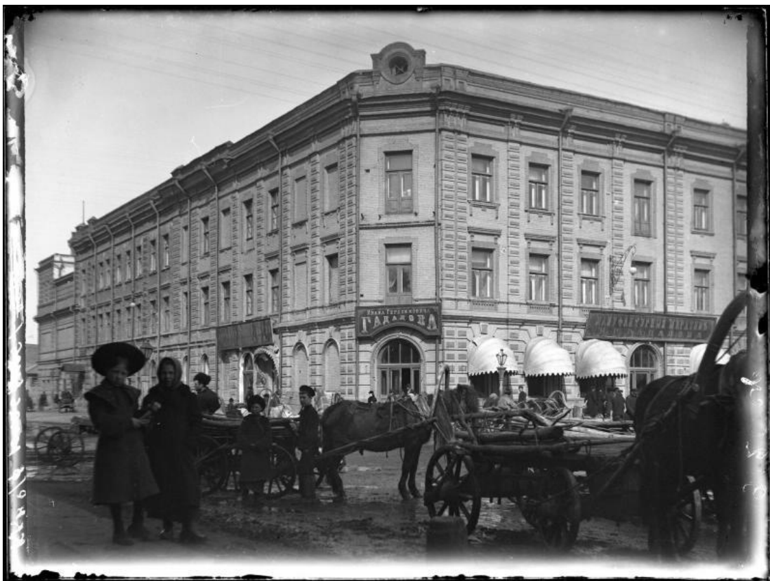
Рис. 2. Торговый дом И.Г. Гадалова. 1900-е гг. [6, № 10426/495].

В период 1885–1887 гг. к торговому дому был пристроен дополнительный объем по ул. Кирова (рис. 2). До 1904 г. было построено здание каменных двухэтажных кладовых. Согласно описи имущества за 1904 г. на территории усадьбы находились «трехэтажный дом размером 25×25 сажень с подвалом, новая пристройка с северного торца 8×8 сажень, каменные кладовые поперек двора 7×21 сажень». [4, с. 495] (рис. 1б).